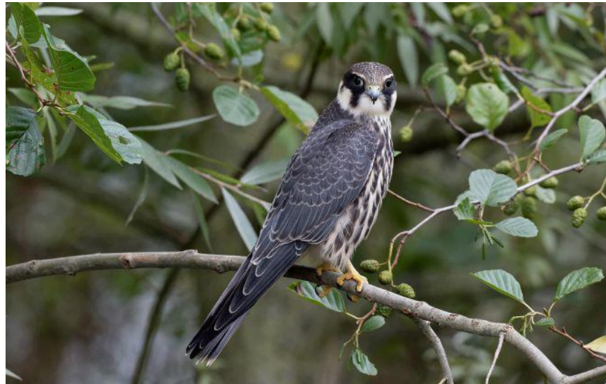
Faucon hobereau juvénile, Neuilly-sur-Marne.